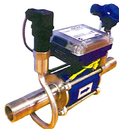
б) вид точки измерения